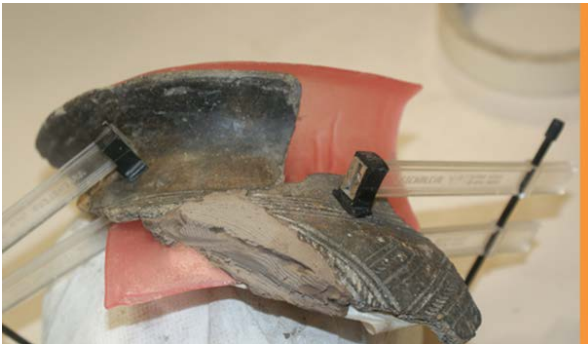
Un vaso in corso di restauro

Questi metodi innovativi permettono anche la ricostruzione di antichi scenari -come la restituzione tridimensionale di capanne preistoriche- che lasciano labili tracce nel terreno, non facilmente riconoscibili a tutti.