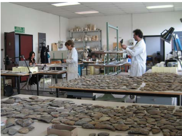
Distesa di reperti ceramici dopo lo scavo, prima del restauro. La ricerca degli attacchi.