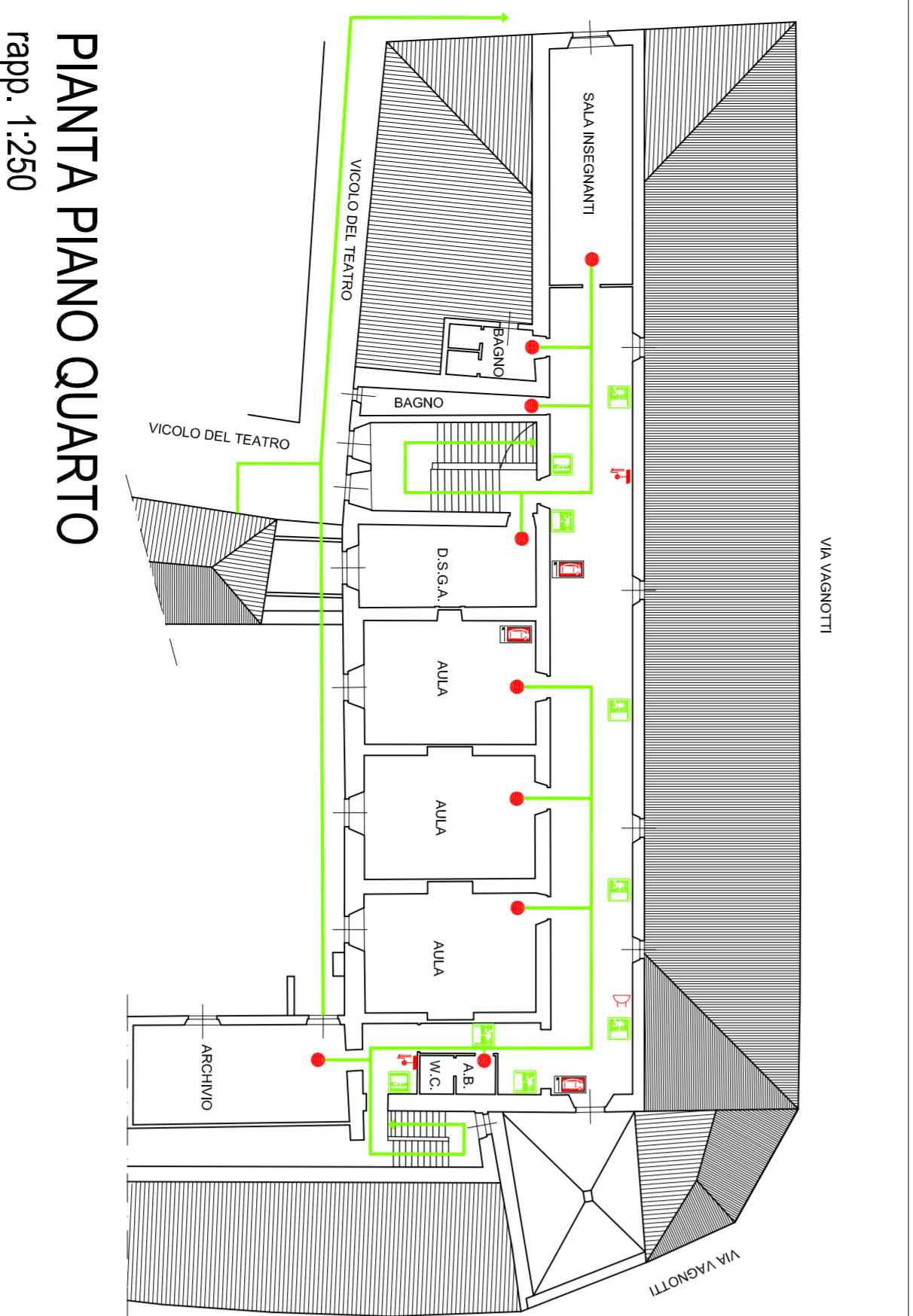
PIANTA PIANO QUARTO rapp. 1:250

Il personale incaricato del controllo delle operazioni di evacuazione , sorveglierà che non si creino intralci lungo le vie di emergenza e interviene in soccorso di coloro che sono in difficoltà.